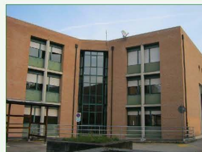
Scuola Statale “Gadda” - Istituto Superiore